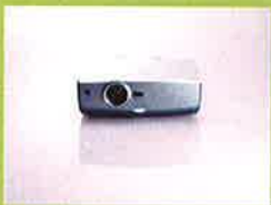
パワープロジェクター