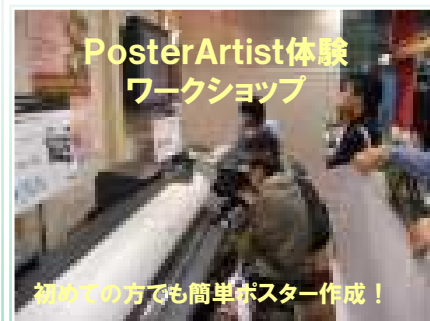
PosterArtist体験 ワークショップ