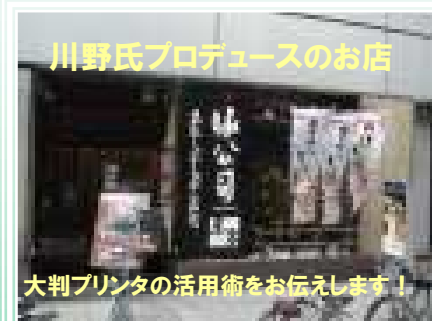
川野氏プロデュースのお店